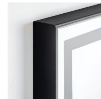
Matt black Negro mate