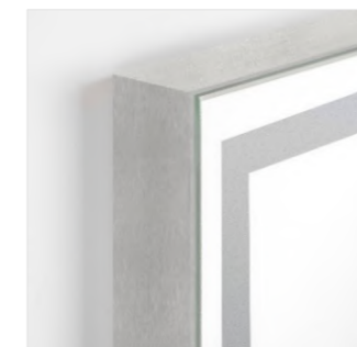
Matt aluminium Aluminio mate